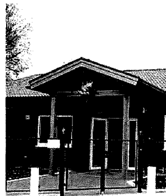
L'asilo nido di Travacò